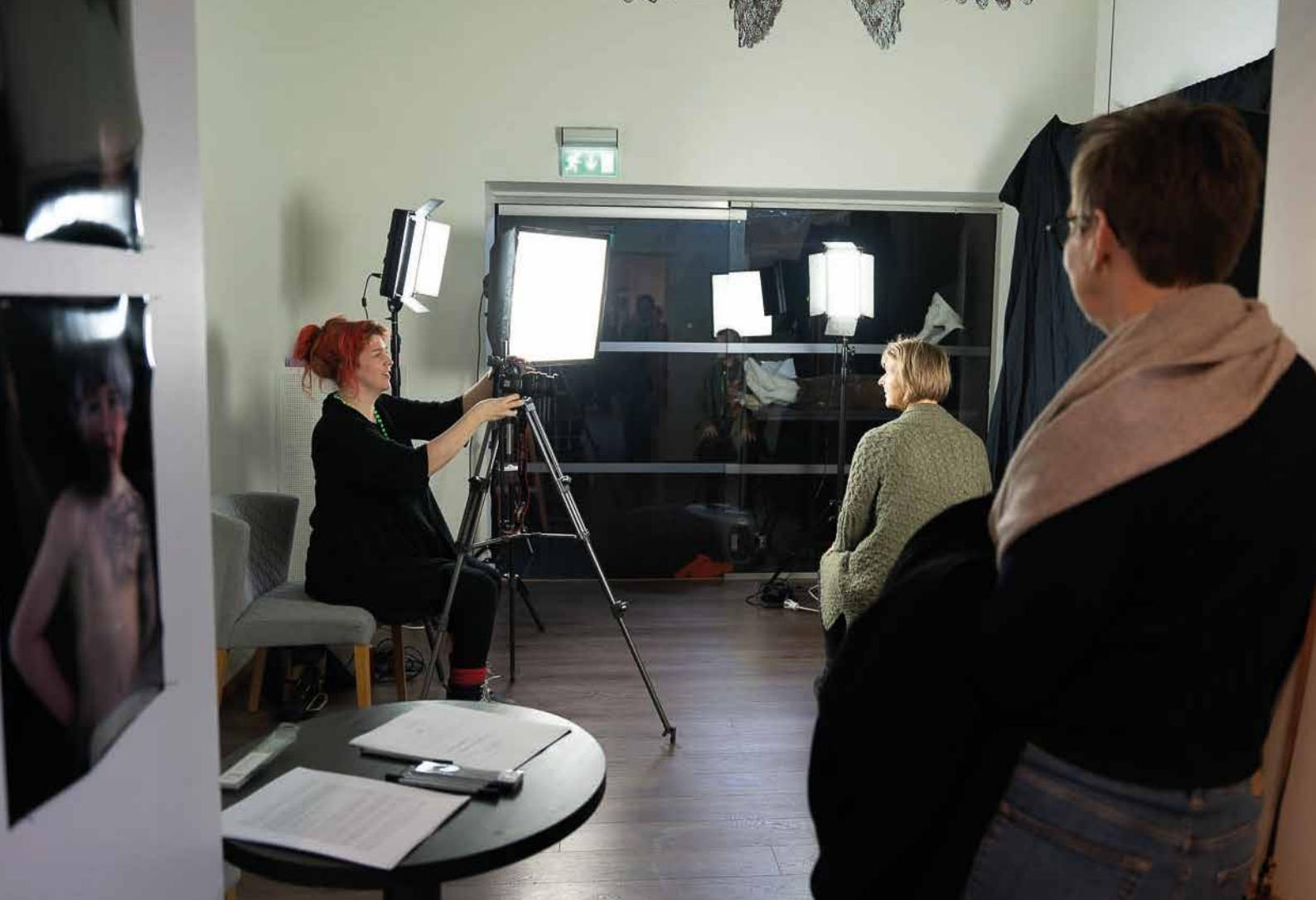
Bilder fra Kunstfestivalen 2022