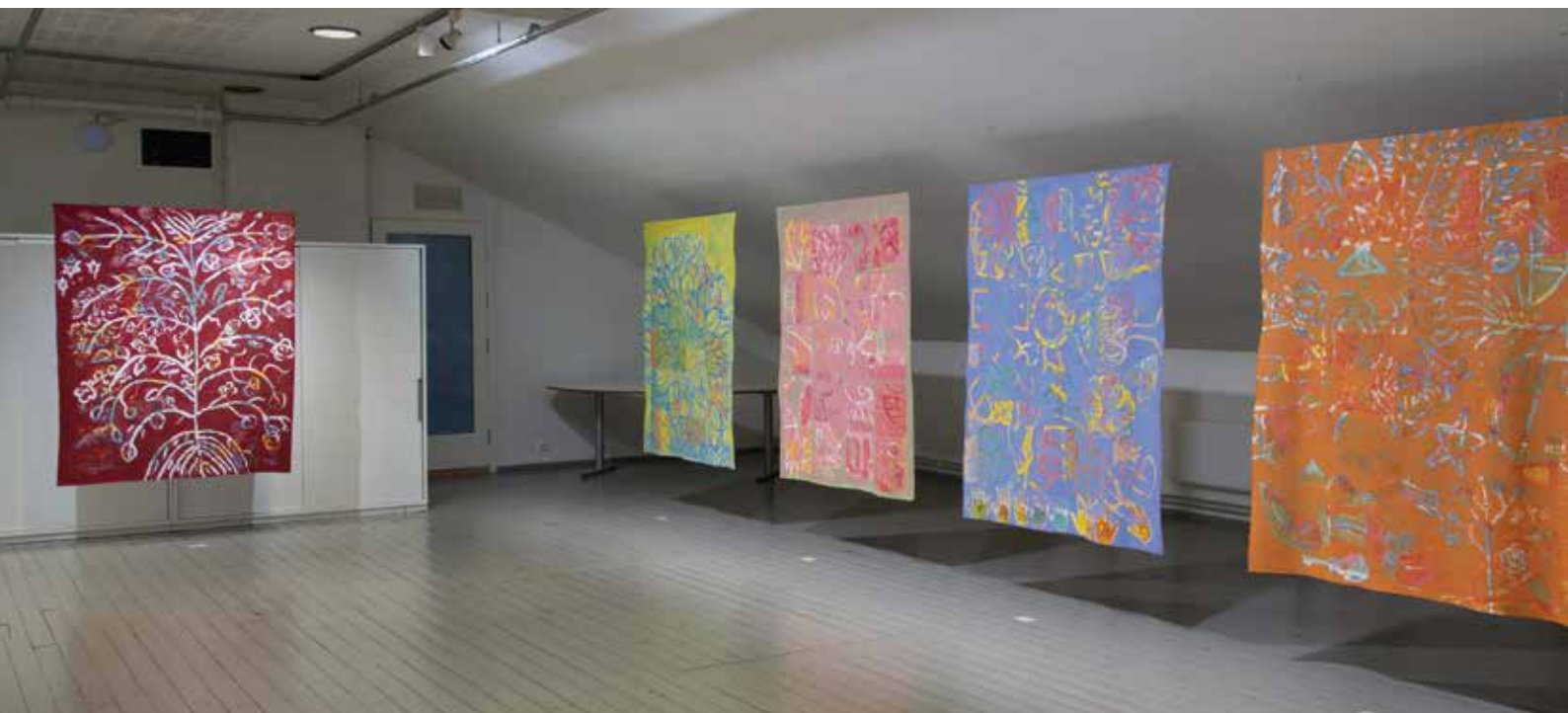
Mitt sted i verden .