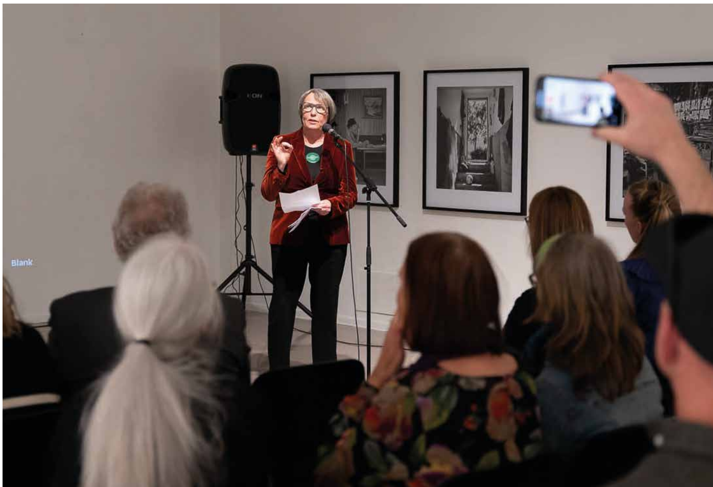
Bilder fra lanseringen av Kunstbankens nye visuelle profil.