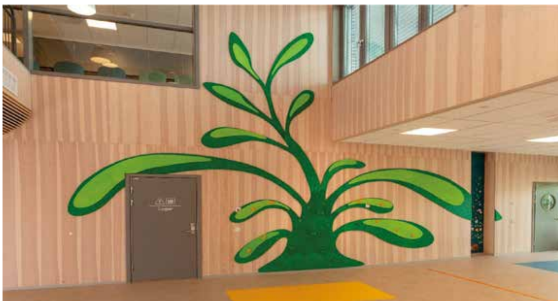
Klatreplanta og Revhiet av Irene Nordli Revhiet barnehage, Løten kommune. Kunstkonsulent: Esther Helén Slagsvold.

OKIOR og OK Hedmark lanserte i 2021 formidlingsprosjektet Kunst i Innlandet med nettside og profiler på Facebook og Instagram. I løpet av prosjektperioden 2021 – 2022 er det postet totalt 24 innlegg.