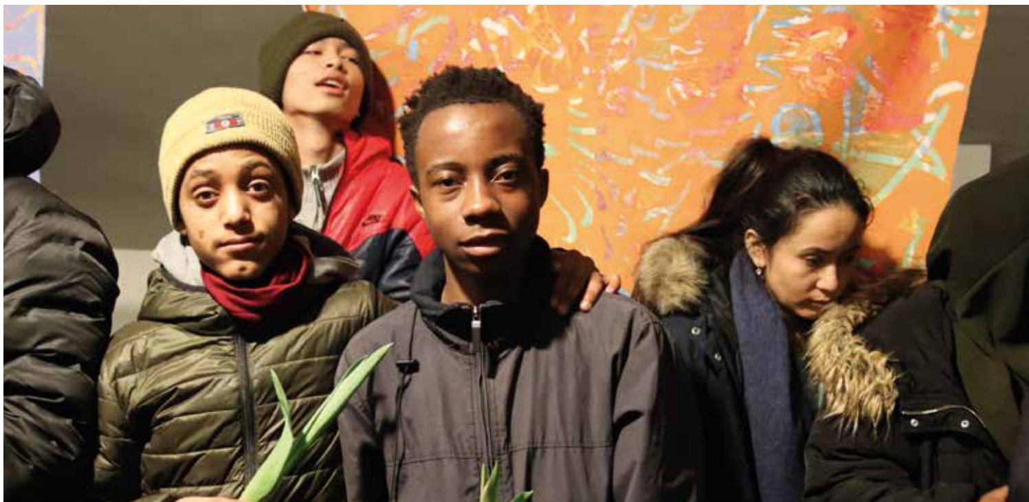
Bilder fra utstillingsåpningen av Mitt sted i verden , 23. februar 2022.

DKS-lab er en verkstedbasert samling med diskusjoner deltagerne imellom. I tillegg til DKS Innlandet og Kunstbanken bidro de profesjonelle utøverne Jarl Flaaten Bjørk og Guro Gjerstadberget med veiledning for å tydeliggjøre deltagerne ideer og metodevalg. I løpet av samlingen ble prosjektene prøvd ut i skolen på barne- og ungdomstrinnet og på videregående skole. Deltagerne fikk også veiledning med tanke på å levere forslag til Kulturtankens portal som har innmeldingsfrist 1. oktober.