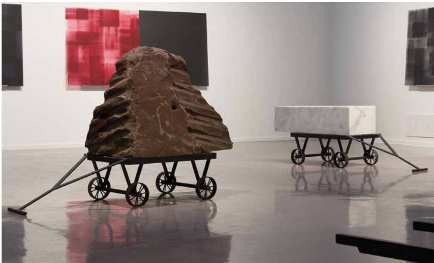
Marit Aanestad, In Transit .