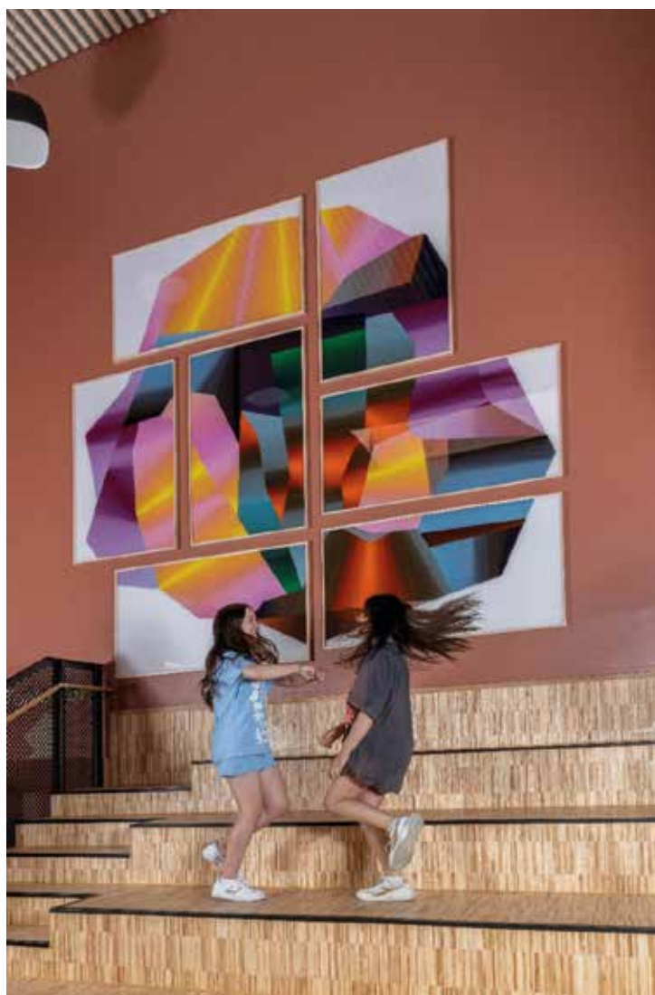
Geometrisk legeme av Esther Marie Bjørnebo Hoberg skole, Stange kommune Kunstkonsulent Malind Solvind Mjølven

Kunstbanken senter for samtidskunst er et regionalt kompetansesenter for offentlig kunst i Innlandet. OK Hedmark leder dette arbeidet og er rådgivende organ for byggherrer (kommuner og fylkeskommune), kunstkonsulenter/kunsthaglige prosjektledere og utførende kunstnere.