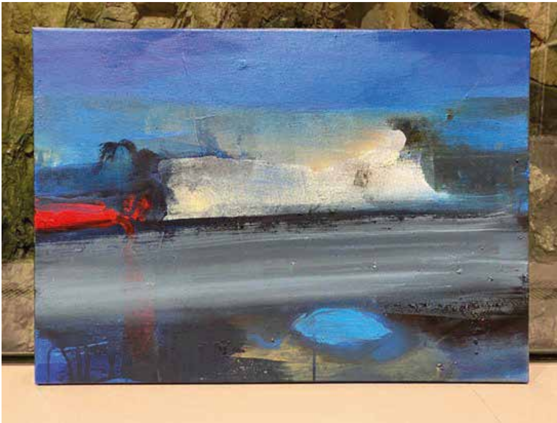
Akrylmaleri av Bjørnulf Dyrud. Foto: Kunstbanken.

Kunstbutikken, som er lokalisert i Kunstbankens resepsjon, jobber aktivt med salg og formidling av billedkunst og kunsthåndverk fra profesjonelle kunstnere – salg av maleri, grafikk, tegning, glass, keramikk, metall, smykker og tekstil. I tillegg selges kunstbøker, utstillingskataloger, kunstkort, plakater og gavekort. På Kunstbankens nettside er det mulig å bestille grafikk, tegninger, bøker og kataloger. Her har vi også korte presentasjoner av kunsthåndverkere. Vi har en egen Instagramkonto for kunstbutikken med ukentlige innlegg av kunstverk for salg. Kunstbutikken fornyes med nye kunstverk gjennom hele året. Faste leverandører leverer stadig nye arbeider og kontakt med nye leverandører knyttes ved behov.