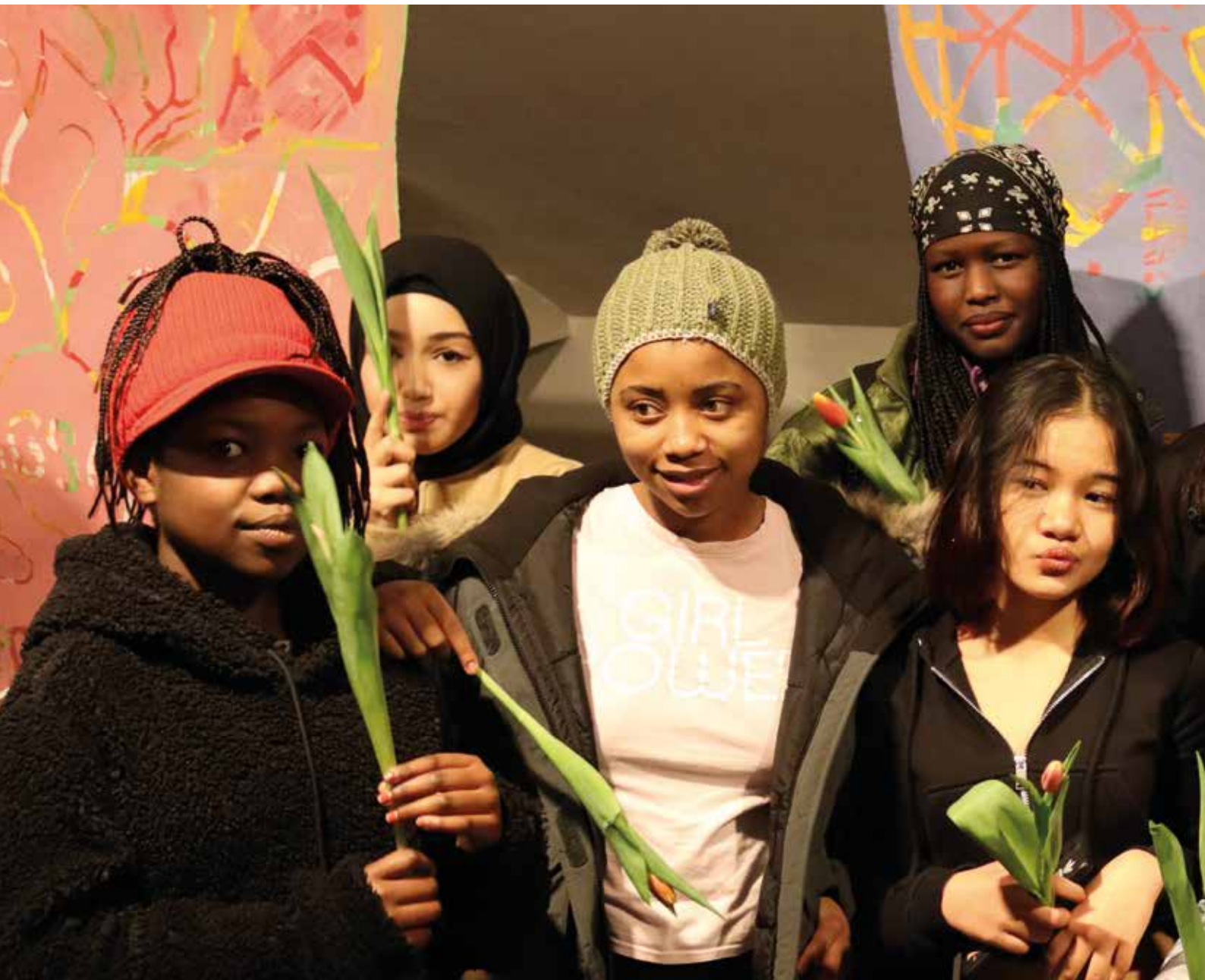
Deltakere på Mitt sted i verden