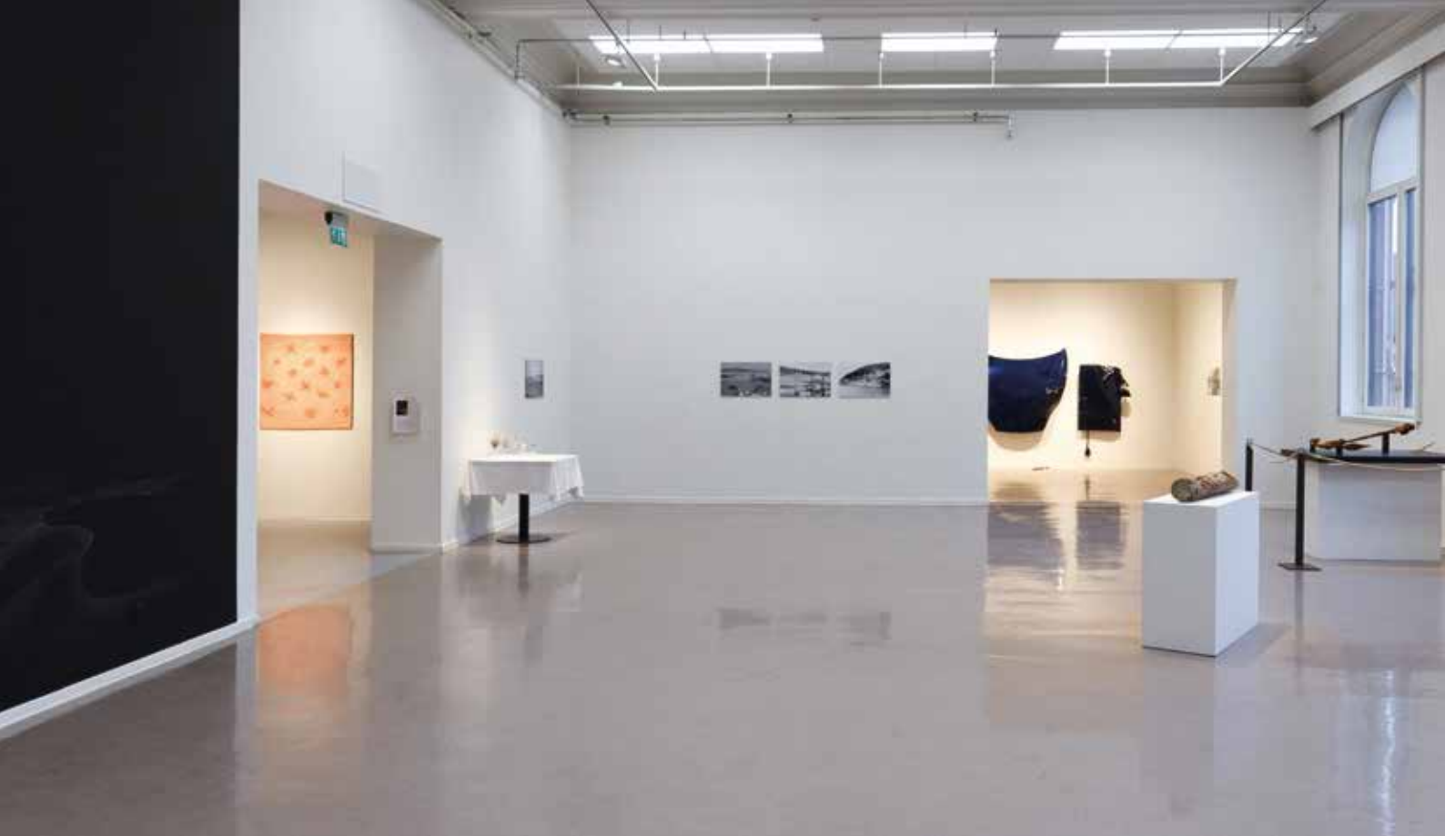
Over: Ingeborg Annie Lindahl, The Transience of Men . Foto: Kunstbanken / Tobias Nordvik Under til venstre: Bodil Mogstad Skipnes, Keramikk . Foto: Kunstbanken / Tobias Nordvik Under til høyre: Ragnhild Enge, Billedvev . Foto: Kunstbanken / Tobias Nordvik