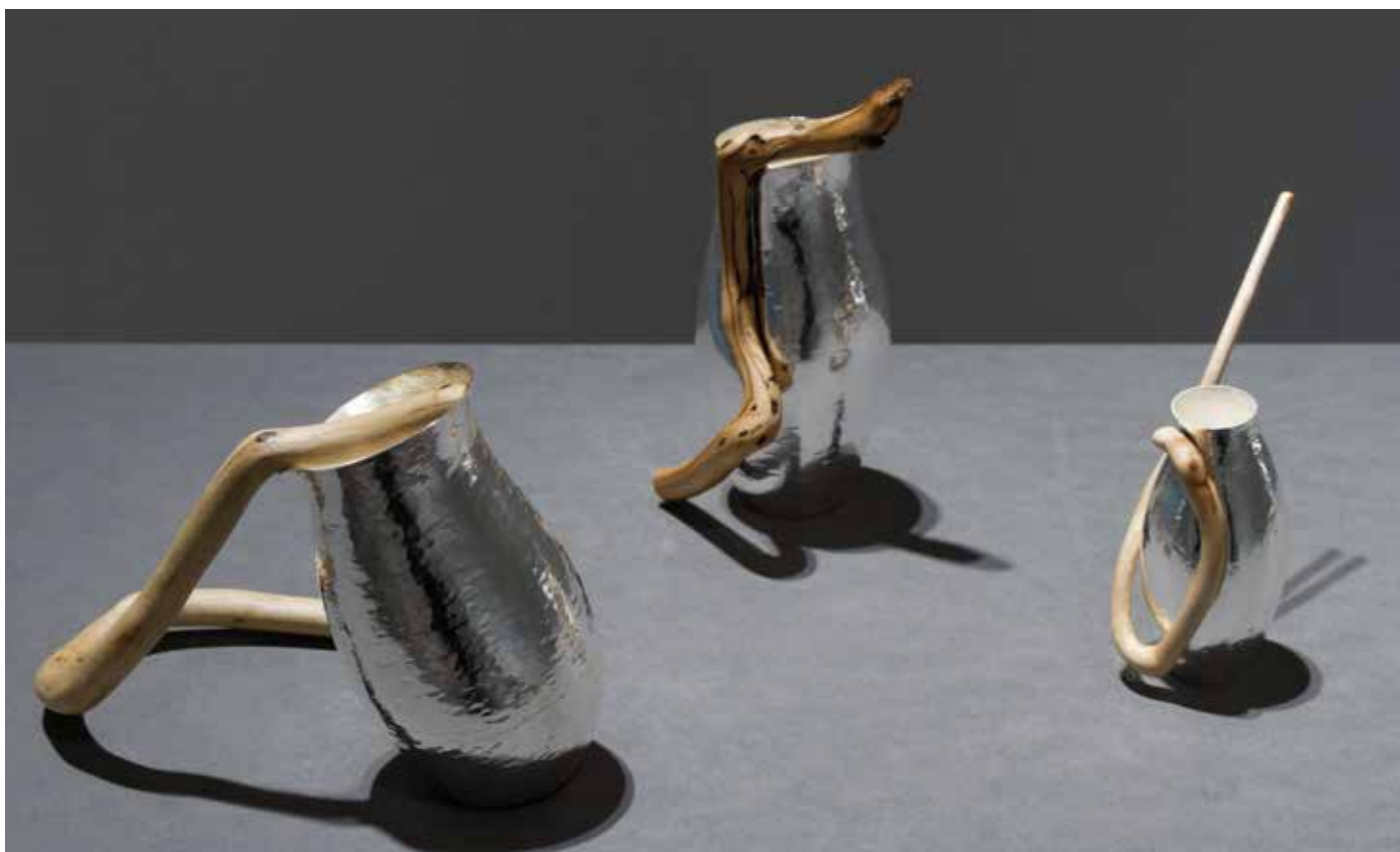
Elin Hedberg, Forgreininger .